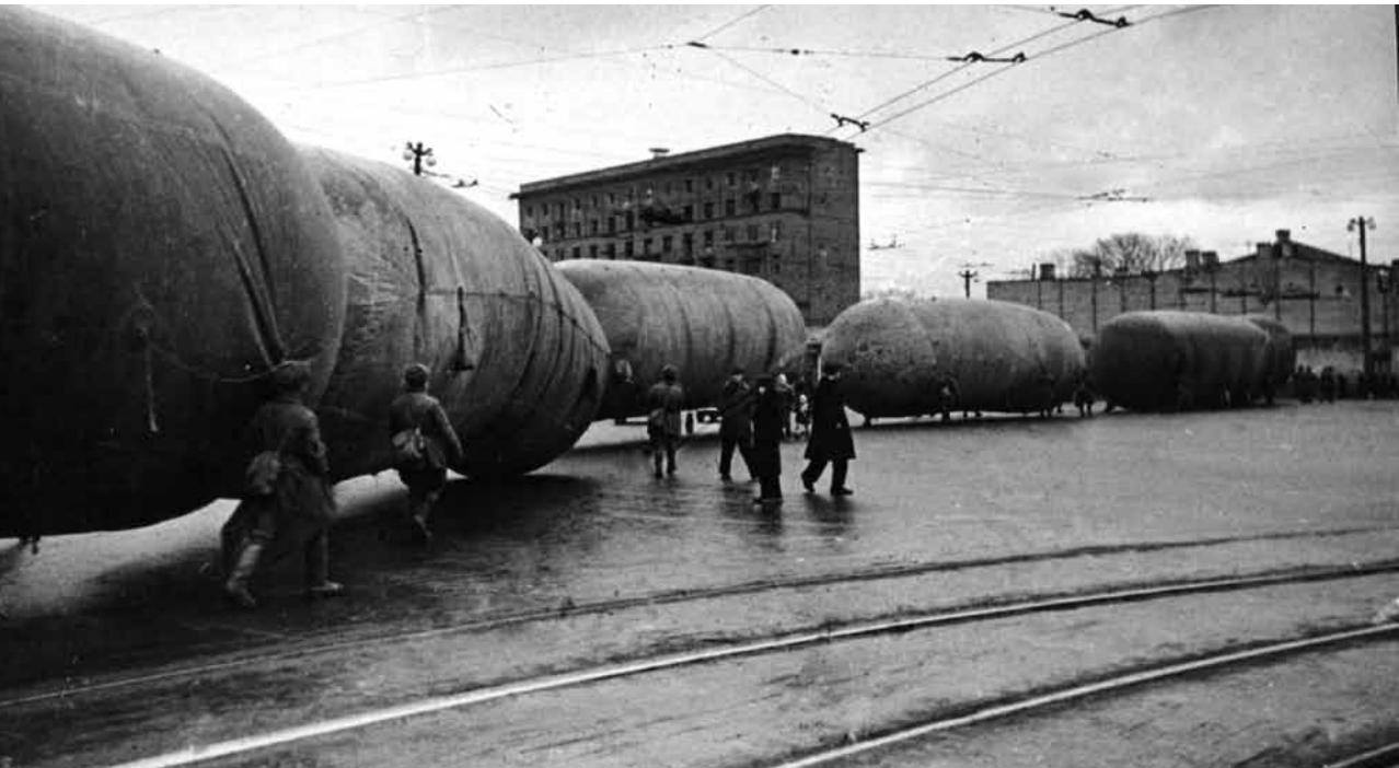
Dujų aerostatai gabenami Maskvos Kalužskajos gatve. 1941 m. spalio.