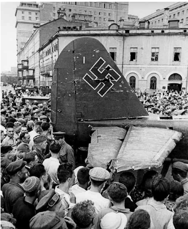
Maskviečiai apžiūri vokiečių lėktuvą „Junkers“ (Ju-88), 1941 m. liepos 25 d. numuštą sovietų 3-iojo naikintuvų korpuso pilotų netoli Istros. Po penkių dienų jis buvo demonstruojamas Sverdlovo (dabar Teatro) aikštėje Maskvoje. Ju-88 priklausė 122-osios žvalgybų grupės 2-ajai tolimųjų žvalgybų eskadrilei (2. (F)/122), atliko žvalgybinį skrydį į Kalugos sritį.