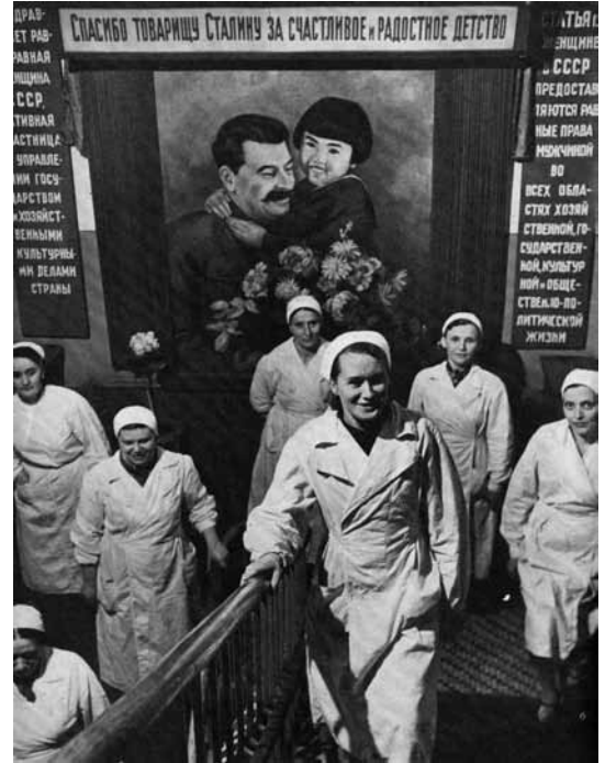
Maskvos ligoninės gydytojai prie plakato „Ačiū draugui Stalinui už laimingą ir džiaugsmingą vaikystę“.