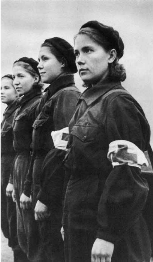
Slaugytojos iš komunistinio darbininkų bataliono, kuris priklausė Maskvos darbininkų diviziono 1-ajam pulkui. 1941 m. spalio.