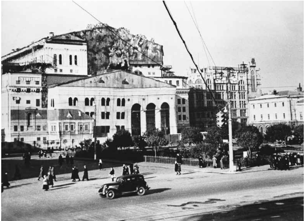
Gyvenamaisiais namais užmaskuotas Didžiojo teatro pastatas.