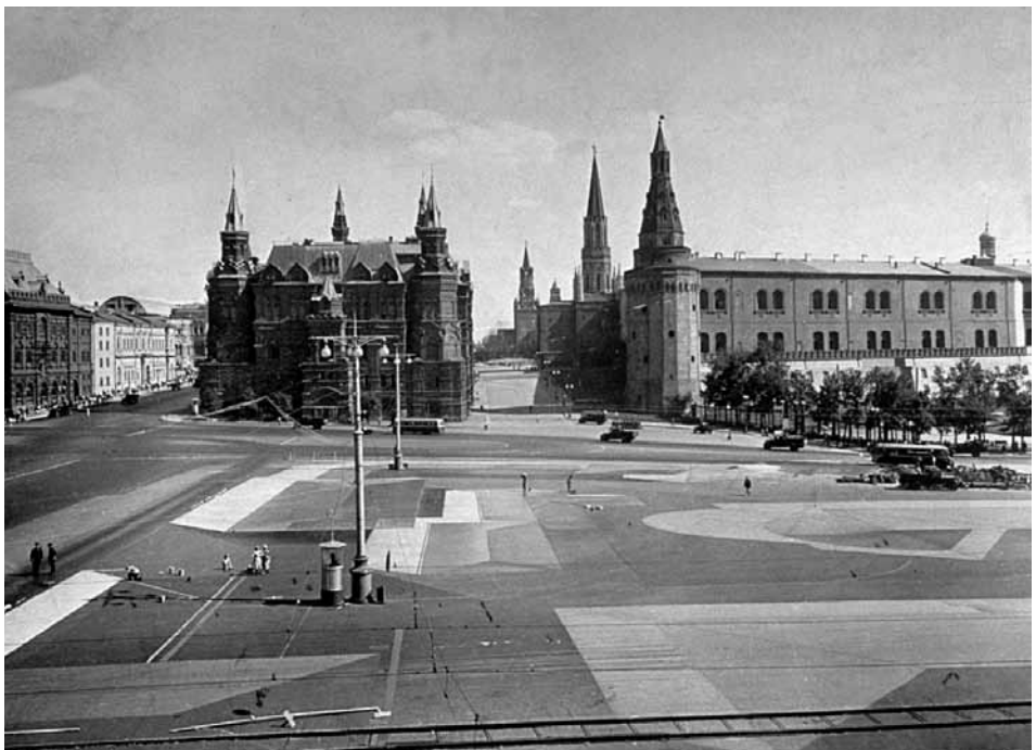
Moterys įrengia maskuotę Maniežnajos aikštėje Maskvoje, kad suklaidintų priešų bombonešių taikytojus.